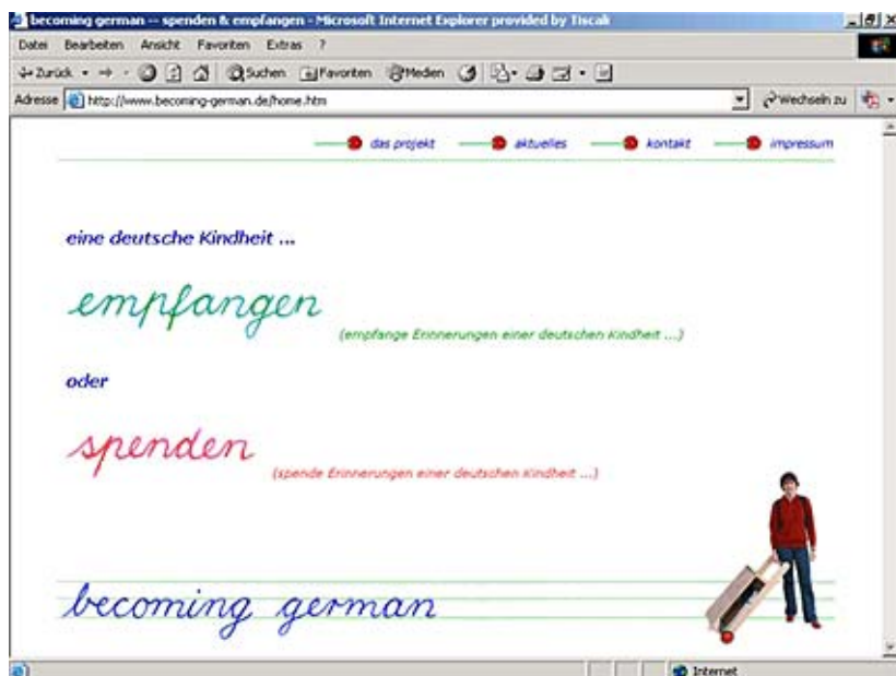
Screenshot der Internet-Datenbank "becoming german" www.becoming-german.de

Die Datenbank befindet sich im Internet unter: www.becoming-german.de