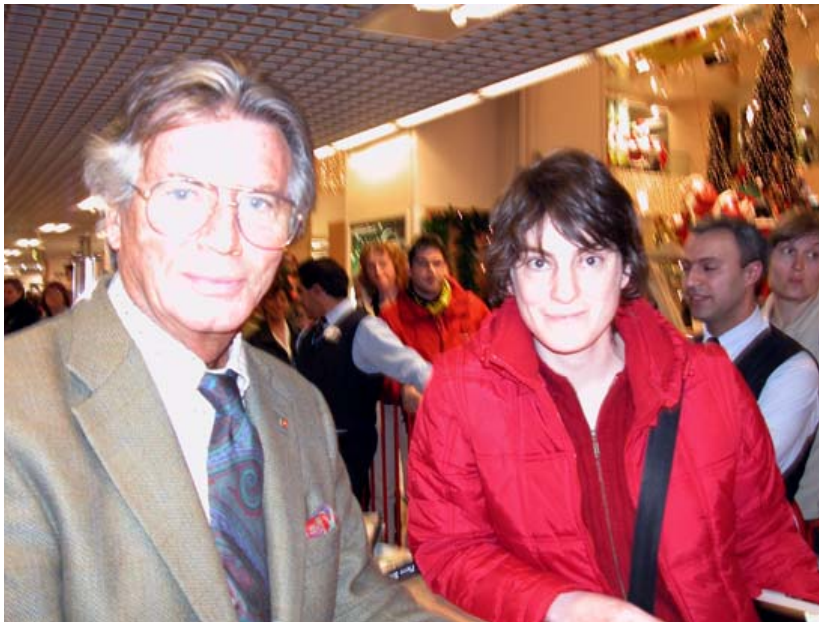
Winnetou und ich, Galeria Kaufhof, Köln, 2004

Ziel der Internet-Datenbank "becoming german" ist es, eine Informationsquelle und Hilfestellung für diejenigen zur Verfügung zu stellen, denen eine deutsche Kindheit fehlt bzw. die gerne "deutsch" werden möchten oder eine andere "deutsche Kindheit" haben wollen.